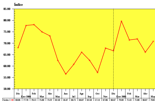
ÍNDICE DE CONFIANZA DE LA ACTIVIDAD ECONÓMICA DICIEMBRE 2003 - MAYO 2005